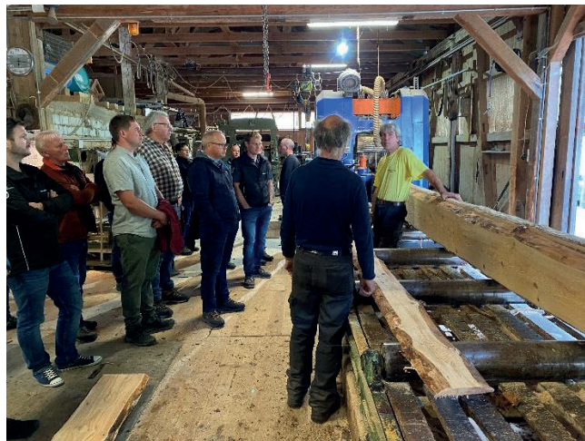
Behördenanlass: Betriebsführung Sägerei Haltinner

Teilnehmern auf, wie der Mensch den Wald in den letzten Jahren immer stärker in der Freizeit nutzt. Das ist nicht falsch, bedingt aber, dass die Beteiligten sich gegenseitig respektieren, den Dialog pflegen und bei Problemen faire Lösungen suchen. Im Anschluss an den Informationsteil traf man sich im Forstwerkhof Mettlen zu einem feinen Nachtessen. Bei angeregten Gesprächen liess man den Abend gemütlich ausklingen.