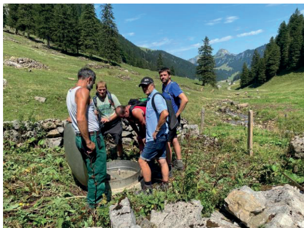
Alpbegehung 05. August 2022

Die laufenden Geschäfte und Aufgaben erledigte der Hofverwaltungsrat an zehn Sitzungen. Die Zusammenarbeit verlief stets in vorbildlicher Offenheit und kollegialem Einvernehmen. Im August 2022 fand die jährliche Alpbegehung mit der Geschäftsprüfungskommission statt.