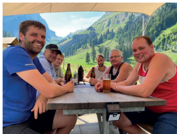
Alpbegehung 05. August 2022

Unter anderem haben Mehreinnahmen beim Holz- und Holzschnitzelverkauf, höhere Erträge Waldarbeiterkosten Dritte und höhere Beiträge von Bund und Kanton dazu beigetragen.